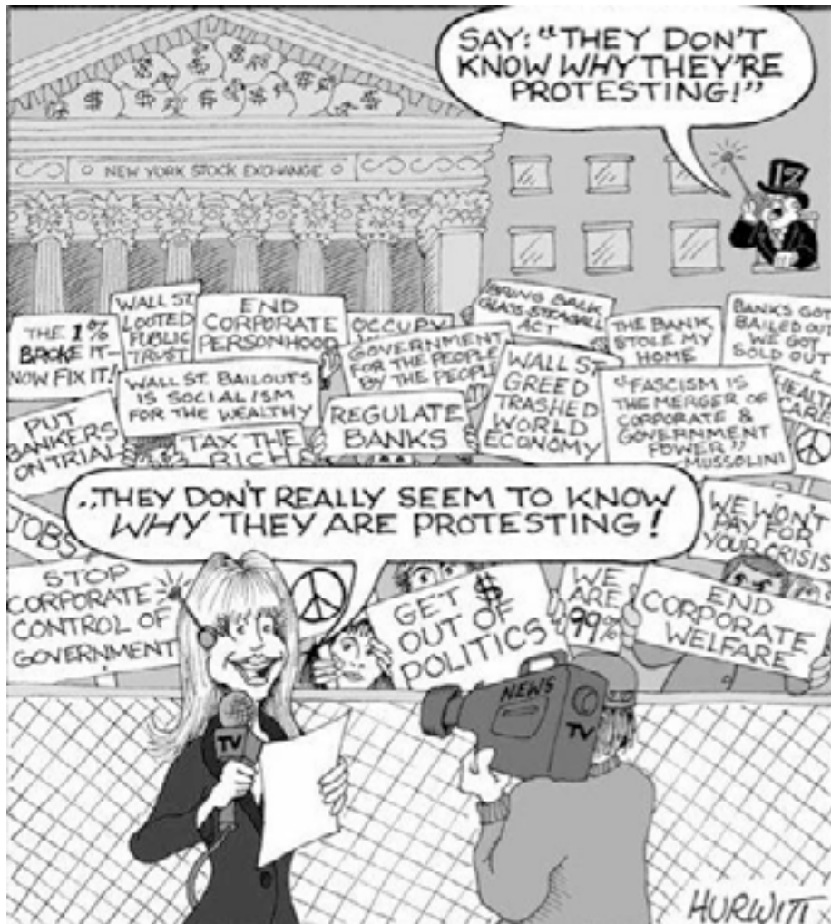
{Bulle d'en haut : "Dites : 'Ils ne savent pas pourquoi ils manifestent !'" – bulle d'en bas : "Ils ne semblent pas vraiment savoir pourquoi ils manifestent !" (N.d.T.)}

Le 10 octobre 2010, le mouvement s'était étendu à pas moins de 900 villes différentes.